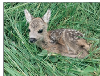
srnčata vypuštěná po řádně ohlášené a provedené seči

srnčata po provedené neohlášené seči ve Svojnících