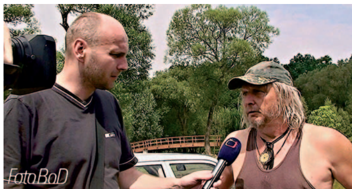
Aleš Hazuka natáčí do reportáže ČT rozhovor s Miroslavem Mottlem.