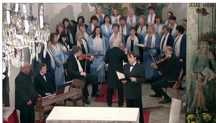
(z TV záznamu 13.4.2012)

Koncert Pěveckého sboru jihočeských učitelek s přednesem v podání Alfreda Strejčka (zcela vlevo dole).