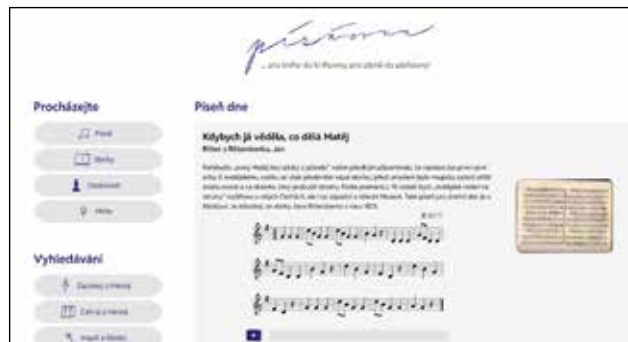
Písňovna a Quido Havlasa str. 7

• Na Úřadu městyse se můžete zaregistrovat do systému třídění (nutné provést osobně), na základě kterého můžete získat slevu na platbu za odvoz domovního odpadu (popelnice). Zde obdržíte samolepicí štítky s čárovým kódem a další podrobné instrukce. Více na www stránkách městyse.