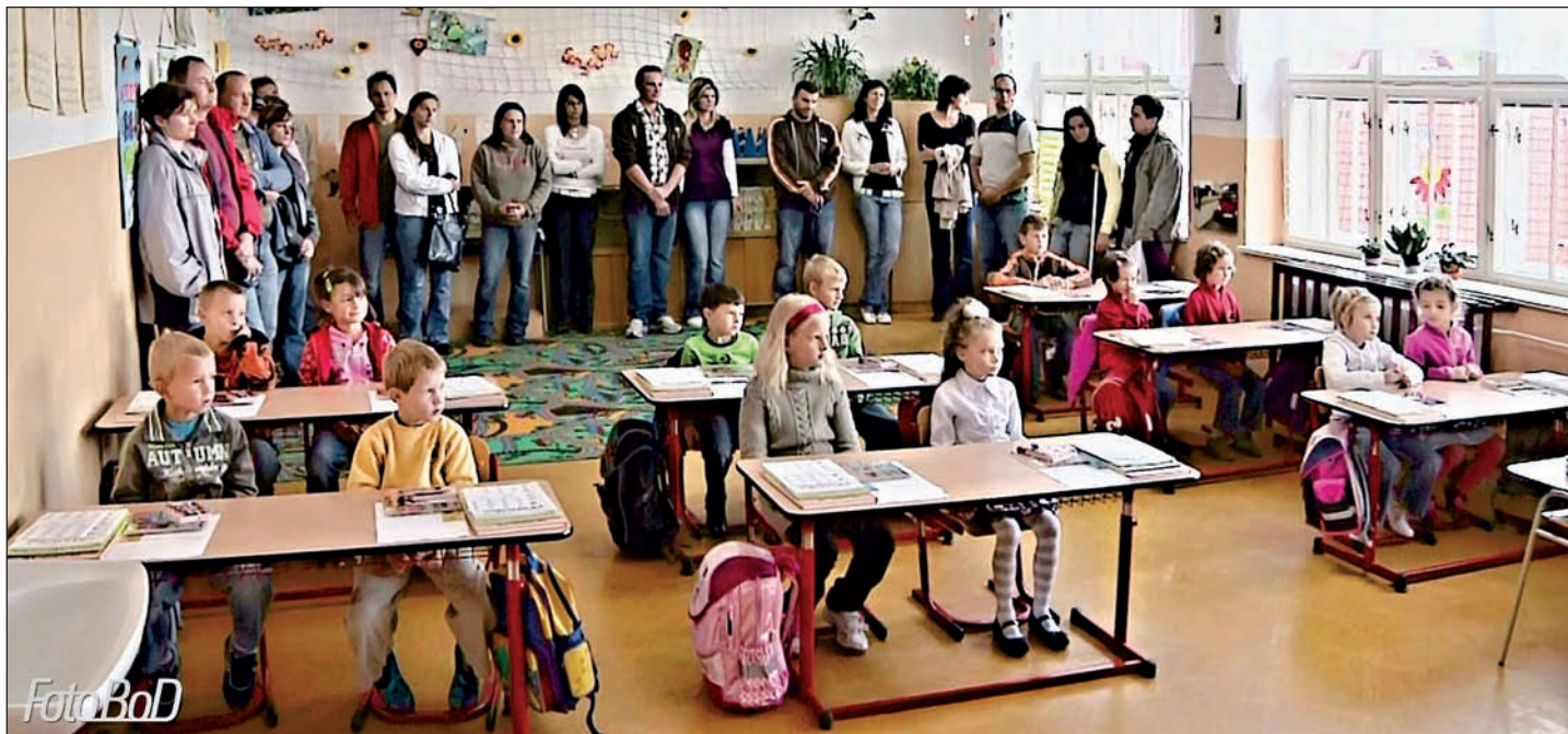
1. září 2010 se opět otevřely dveře naší školy a do lavic usedli také prvňáčci. Tak ať se jim ve škole líbí.