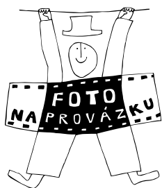
Foto na provázku po sedmé...