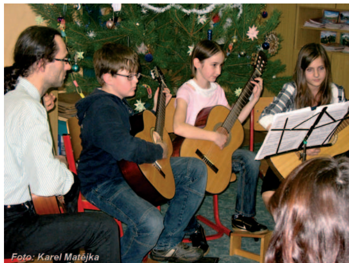
Adventní koncert žáků ZUŠ Vlachovo Březí pobočka Strunkovice nad Blanicí.

Koncert se konal v budově I. stupně ZŠ Strunkovice 17.12.2009.