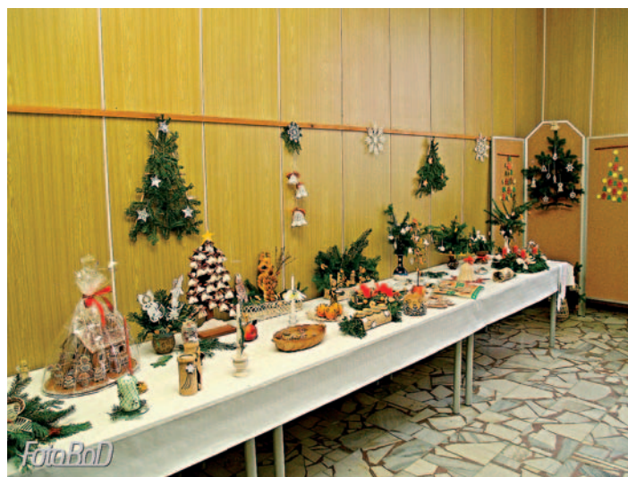
Terezie Holátová, Klub dovedných rukou

V lednu se budou schůzky Klubu dovedných rukou konat ve školní jídelně, a to od 18:00 hodin. Těšit se můžete na háčkovanou bižutérii zdobenou korálky (6. ledna) a pletení košíčků, krabic a rámečků z papírových ruliček (20. ledna). Jako vždy zveme další zájemce, kteří se chtějí něco nového naučit.