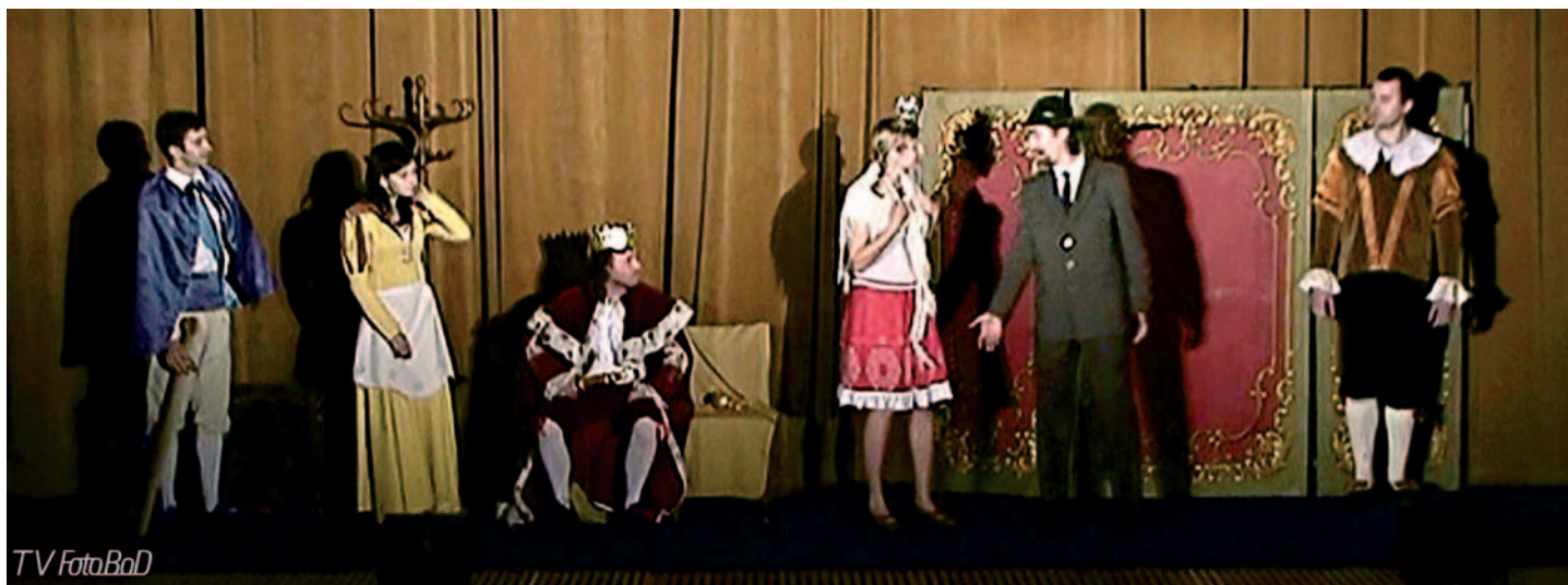
6. prosince 2009 se v kinosále Kulturního domu uskutečnila repríza pohádky „Čertova nevěsta“ Sál byl opět plný a členové Strunkovického Ochoťnického Spolku (S.O.S.) připravili malým i velkým divákům krásný zážitek.