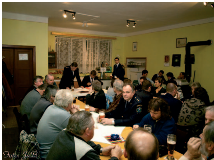
Valná hromada SDH Svojnice, 16.12.2009 v KD Svojnice