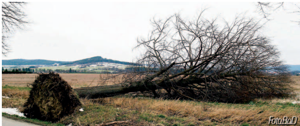
Orkán Kyrill vyvrátil i tento strom u silnice mezi letištěm a Strunkovicemi nad Blanicí.