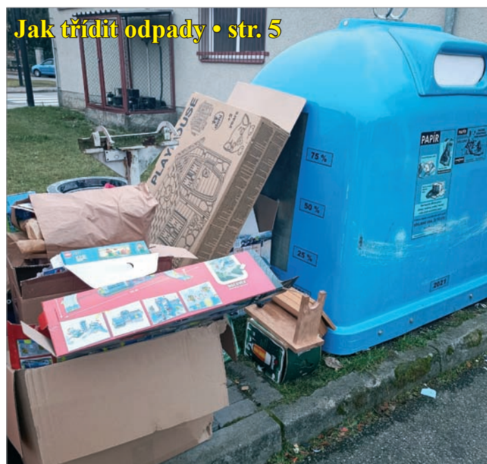
Jak třídit odpady • str. 5