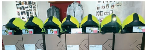
Zásahové přílby a integrované svítilny

byl realizován za finanční podpory z Dotačního programu Jihočeského kraje Neinvestiční dotace pro jednotky sborů dobrovolných hasičů obcí Jihočeského kraje, 1. výzva pro rok 2025.