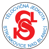
Foto na provázku

Stručná rekapitulace 25. ročníku výstavy FOTO na PROVÁZKU. I letošní ročník proběhl pod ochrannými křídly T.J. Sokol Strunkovice nad Blanicí.