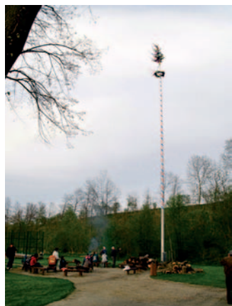
Strunkovice nad Blanicí