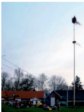
Velký Bor