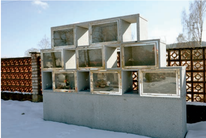
Kolumbárium na hřbitově ve Strunkovicích nad Blanicí