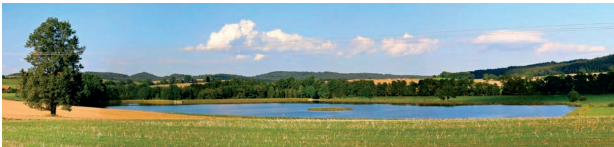
Nový rybník mezi Protivcem a Šipounem

Ročenka městyse Strunkovice nad Blanicí 2017, vydává Městys Strunkovice nad Blanicí jako přílohu Zpravodaje č. 3/2018.