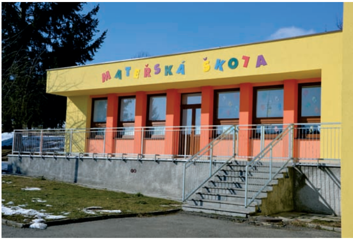
MŠ Strunkovice nad Blanicí - oprava fasády a terasy