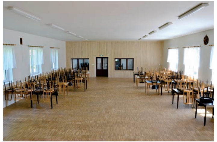
KD Svojnice - akustické obložení stěny