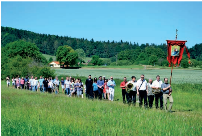
Velký Bor - pouťové procesí