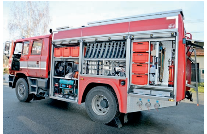
Nová cisternová automobilová stříkačka CAS 20 – TATRA 815 4x4.2