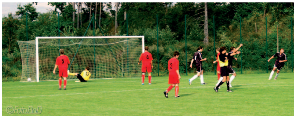
Domácí Strunkovice porazily celek Chelčic 4:3. Náš snímek zachycuje míč v síti chelčického brankáře.